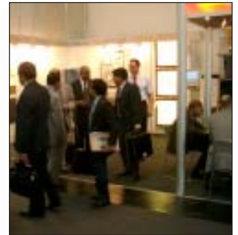
Internationaler Besuch am KIWO-Stand

Die nächste ceramitec öffnet ihre Pforten vom 10. bis 14. Oktober 2006.