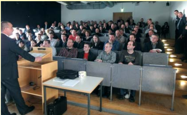
Gesammelte Siebdruck-Kompetenz bei den Kurzvorträgen

In der HdM war am ersten März so richtig was los: Rund 120 Siebdruck-Experten hatten sich eingefunden, um über ihre Branche zu diskutieren, sich qualifiziert weiterzubilden und sich unter „Gleichgesinnten“ vielfältige Anregungen zu holen. Den Rahmen der Veranstaltung bildeten 20-minütige Kurzvorträge ausgewählter namhafter Referenten. Hier wurden unter anderem technische Weiterentwicklungen, Produktneuerheiten und die Zukunft des Siebdrucks thematisiert.