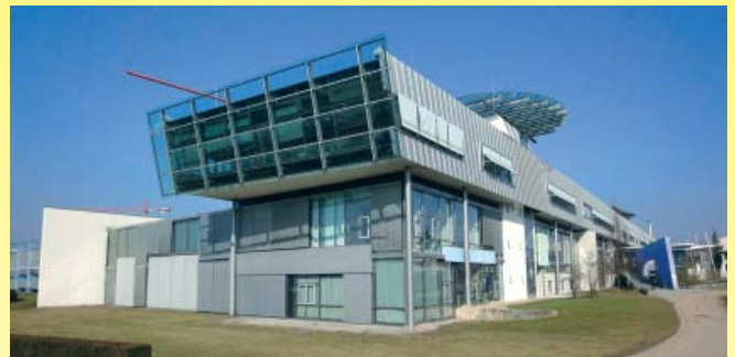
Das Gebäude der Hochschule der Medien

In den Pausen wurde im Foyer das Gespräch mit Kollegen und Referenten gesucht. Heiß wurde diskutiert, wie es um die Zukunft des Siebdrucks steht. Übereinstimmend wurde die Kombination des Siebdrucks mit anderen Druckverfahren und die Konzentration auf die Stärken des Siebdrucks als wichtige Erfolgsfaktoren bewertet. Das Verfahren sollte dort genutzt werden, wo es technisch und wirtschaftlich sinnvoll ist: bei Funktionen, Dekorationen und Effekten. Also genau in den Bereichen, in denen kein