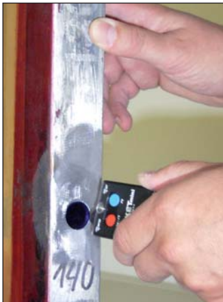
Sicher und lösemittelfest: Der alltagstaugliche RFID-Transponder

Jetzt werden Siebdrucker-Träume wahr: Prozesssicherheit und ein Höchstmaß an Standardisierung – dies wird durch die innovative Lösung der Firma Internet Global Services IGS GmbH und deren Vertriebspartnern Wirklichkeit. Denn der Datenaustausch zwischen den am Siebdruckprozess beteiligten Komponenten ist technisch gelöst und lässt sich praxistgerecht nutzen. Möglich macht dies der RFID-Transponder als