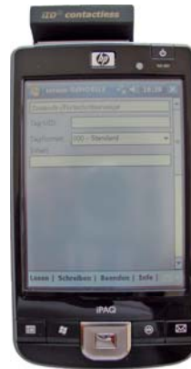
Der Hand-Held ermöglicht das Auslesen und Visualisieren der Daten

Weitere Infos im Internet unter www.igs-gmbh.de und bei Ihrem Siebdruck-Partner vor Ort.