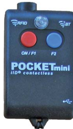
Bluetooth-Lesegerät als mobiler Datenspeicher