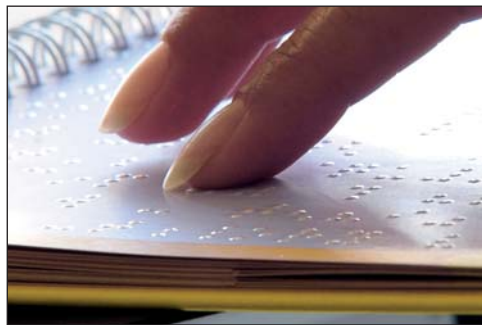
Siebdrucktechnische Umsetzung des Braille-Alphabets

Problem. Was die Geometrie eines 21 – 140 W Gewebes betrifft, wird der Druck von einzig taktilen Warnzeichen schwierig. Dies bezieht sich sowohl auf die Auflösung (Norm 1,5 mm Strichdurchmesser) als auch auf das schlechtere Auslöseverhalten sowie Schmierverhalten im Druckprozess. Es empfiehlt sich daher ein 32-70 Y Gewebe, welches bei entsprechender Beschichtungstechnik ein gutes Druckverhalten von taktilen Warndreiecken gewährleistet. Aufbaudicken von 0,2 mm bis 0,3 mm sind bei diesem Gewebe mit entsprechender Kopierschicht und Beschichtungstechnik ohne weiteres möglich. Sollen Braillepunkte und taktile Fortsetzung auf Seite 2