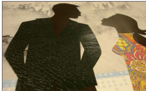
Haptische Struktureffekte für die Mode (Lederimitation)