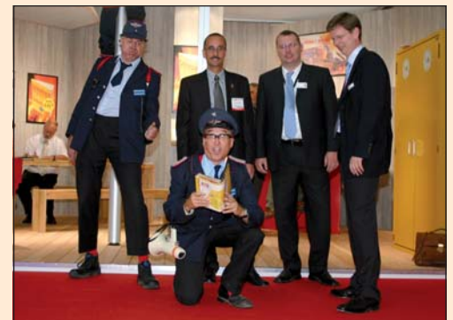
FESPA 2005: Feurige Unterhaltung und brandheiße Infos

Marabu Digital finden Sie in Halle B1, Stand 440 und der Bereich Siebdruck/Tampondruck präsentiert sich in Halle A1, Stand 320. Unter dem Motto „Ink Experts at Your Side“ zeigt Marabu diverse Farb-Neuheiten und beeindruckt an beiden Ständen mit Live-Demonstrationen. Der MCD-Micro feiert hier ebenfalls seine Weltpremiere und wird für neugierige Augen sorgen. Ebenfalls in Halle A1, Stand 229, stellt Sefar viele Neuheiten vor – und stellt sich den Fragen der Besucher. In Halle A1, Stand 125, zeigt sich Ulano in diesem Jahr von seiner internationalen Seite und wird vom Mutterkonzern vertreten. Seien Sie dabei und entdecken Sie Service- und Produkt-Neuheiten, mit denen Sie Ihren Betrieb „up to date“ halten!